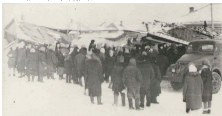
Процесс разрушения дома