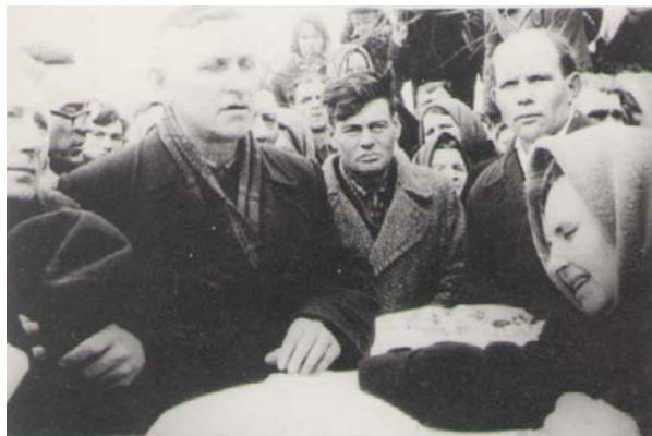
Парторг отрывает руки жены умершего от гроба.