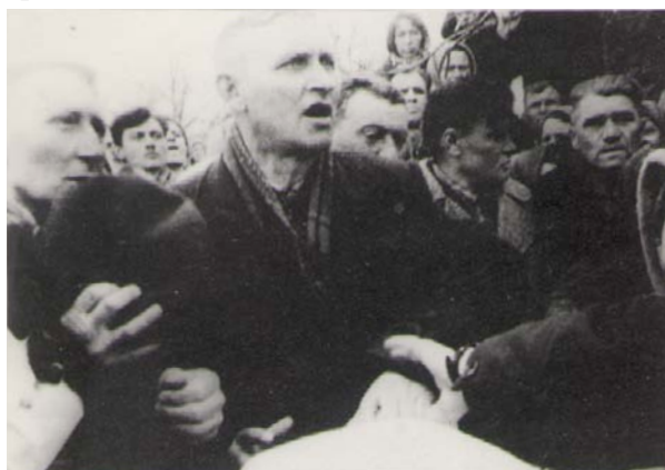
Парторг отрывает руки жены умершего от гроба, а сын отталкивает его руку, не даёт гроб.