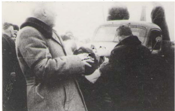
Отняв гроб, развернув машину в другую сторону, ехать другой стороной, — жена и сыновья стали впереди машины препятствуя чинить произвол, применив физическую силу, родных удалили с дороги. Такова действительность.