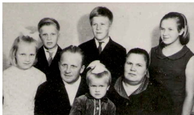
г. Ленинград к-30 пос Заневка-35