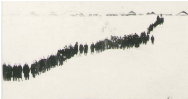
Верующие ЕХБ г. Барнаула на пути к райисполкому с ходатайством предотвращения разрушения молитвенного дома.